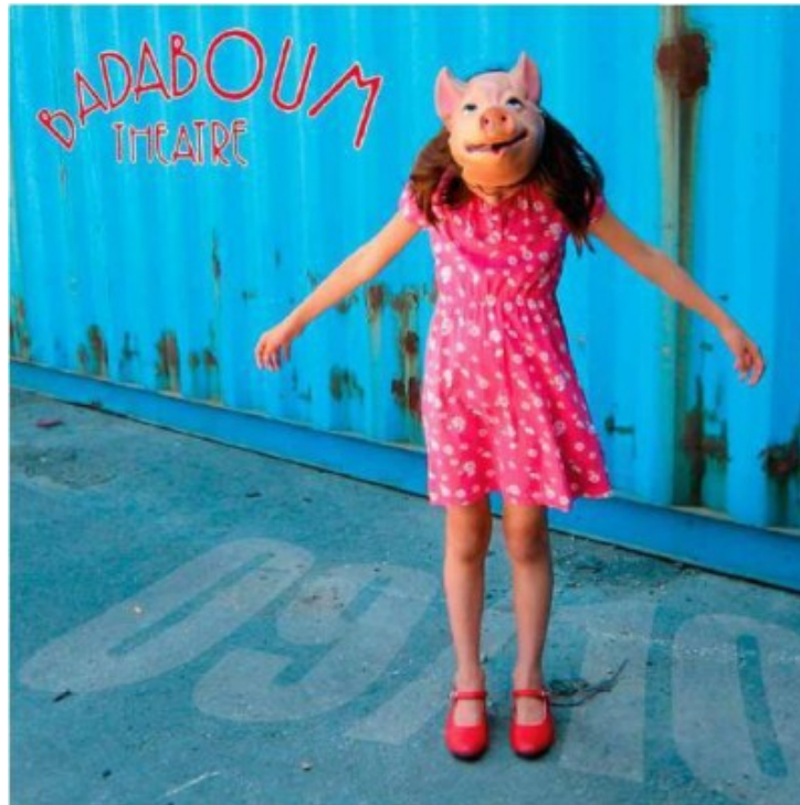
La Badaboum théâtre.

Au théâtre Badaboum les enfants sont acteurs et spectateurs. Située tout près du Vieux Port, voici une bonne adresse pour sensibiliser tout au long de l'année vos enfants au monde artistique.